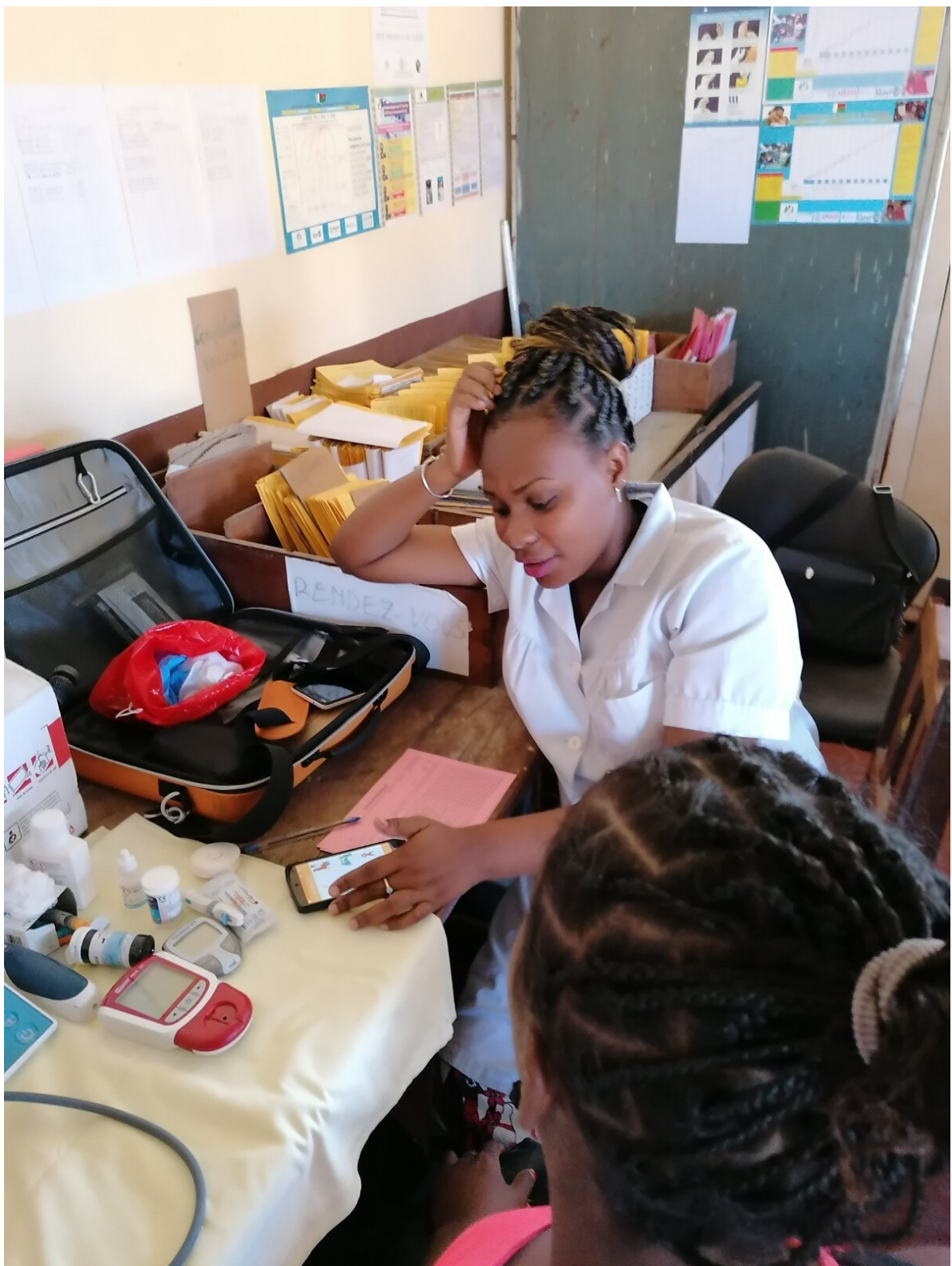
Une sage-femme lors de sa consultation avec une femme enceinte au centre hospitalier d'Ambanja à Madagascar.

Nous menons cette formation, ainsi que d'autres actions de renforcement de compétences des prestataires de soins, directement avec l'implication d'institutions nationales et des ministères de santé pour garantir des changements durables du système de santé.