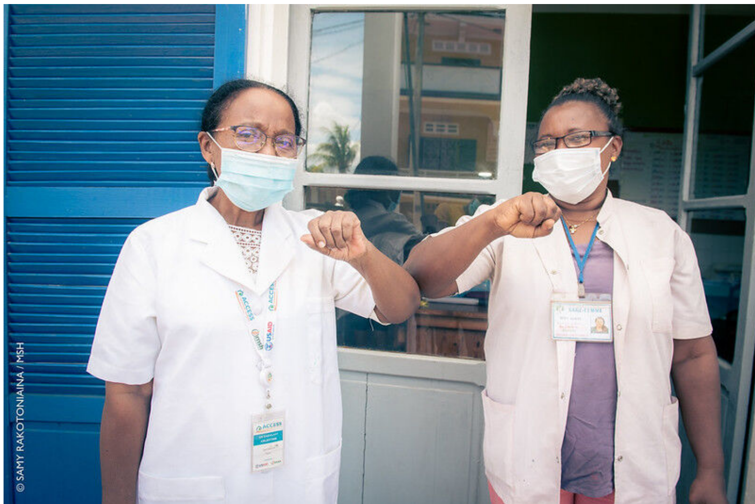
Madagascar COVID-19 Health Workers. Photo: USAID U.S. Agency for International Development/flickr.com; CC BY-NC 4.0 Deed