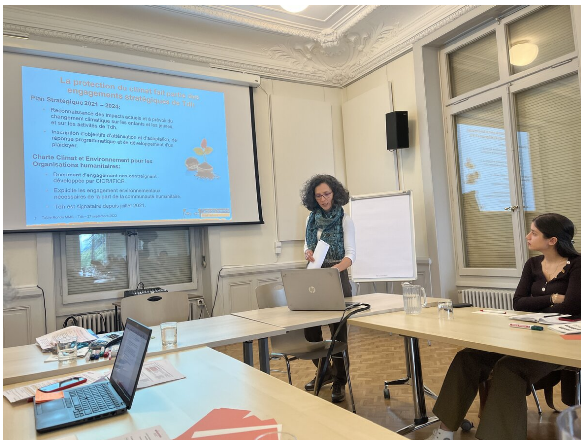
MMS Table ronde 2022.