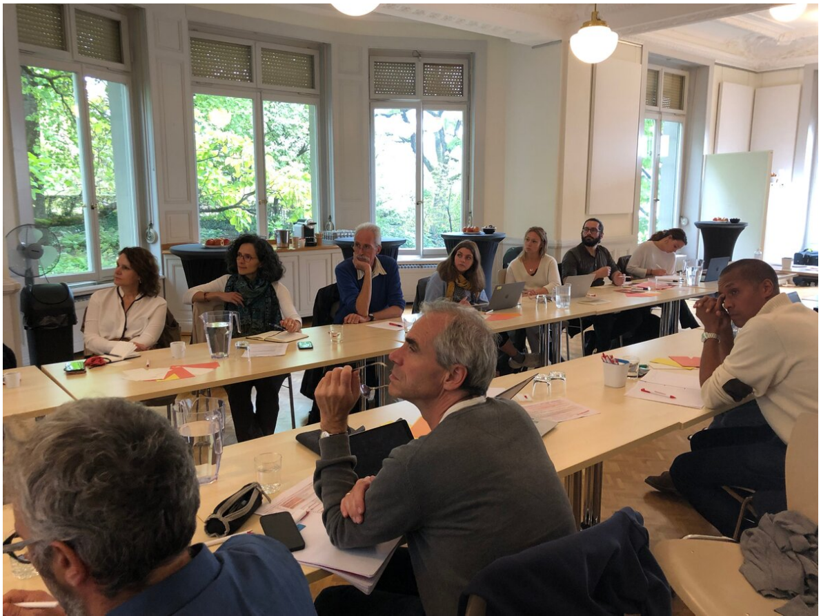
MMS Table ronde 2022.