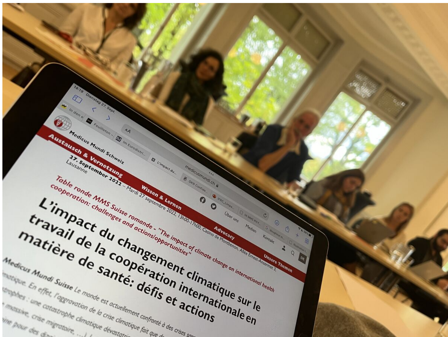
MMS Table ronde 2022.

Le monde est actuellement confronté à des crises sans précédent, notamment à celle de l'urgence climatique. En effet, l'aggravation de la crise climatique fait que des pays sont frappés simultanément par plusieurs catastrophes : une catastrophe climatique dévastatrice (inondations, sécheresse) et une catastrophe humanitaire (famine massive, crise migratoire). La pénurie d'eau et un contexte de conflits armés représentent une double peine pour des dizaines de millions de personnes aujourd'hui. En outre, l'OMS estime que le changement climatique causera environ 250 000 décès par an entre 2030 et 2050, dus aux maladies transmissibles et non transmissibles liées au climat. Le coût du changement climatique sur les frais de santé atteindra jusqu'à 2 à 4 milliards de dollars/an d'ici 2030.