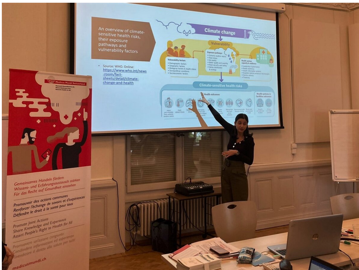
MMS Table ronde 2022.

Selon la Plateforme intergouvernementale scientifique et politique sur la biodiversité et les services écosystémiques (IPBES), les tendances actuelles en matière de perte de biodiversité et de dégradation des écosystèmes compromettent les progrès vers 80 % (35 sur 44) des objectifs de développement durable liés à la pauvreté, la faim, la santé, l'eau, les villes, le climat, les océans et la terre.