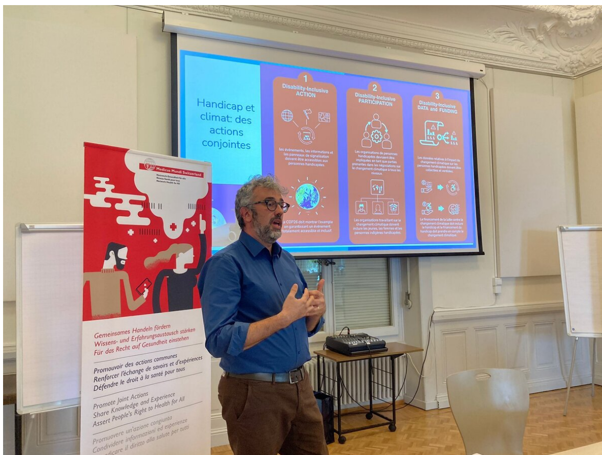
MMS Table ronde 2022.