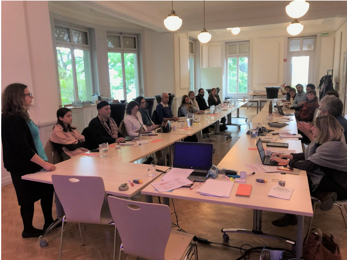
MMS Table ronde 2022.

Les participant.e.s rappellent l'impact différencié du changement climatique qui frappe le plus durement les plus pauvres et les plus vulnérables, creusant les inégalités existantes et créant de nouvelles vulnérabilités à travers ses impacts sur, par exemple, la santé et le WASH (Water-Sanitation-Hygiene), sur la nutrition, sur la qualité de l'air, sur les moyens de subsistance, sur la productivité du travail et les revenus et sur les déplacements des populations. En effet, ce sont les pays qui ont le moins contribué au changement climatique qui souffrent des plus grands impacts.