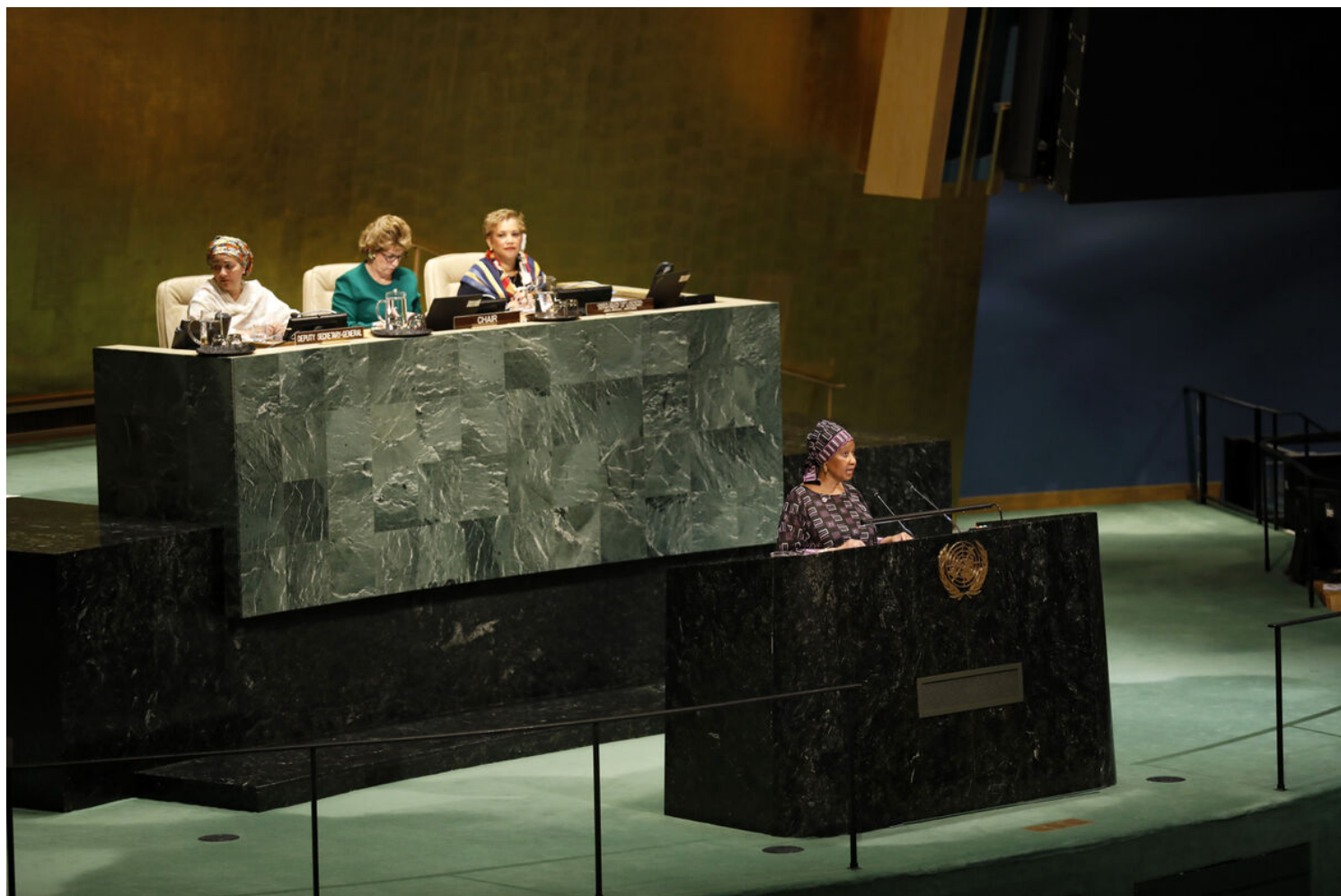
#CSW63 - Opening of the 63rd Session of the Commission on the Status of Women.

Vor 25 Jahren hat in Peking die Vierte UNO-Weltfrauenkonferenz stattgefunden, an der 189 Staaten die wegweisende Peking Deklaration und Aktionsplattform verabschiedeten. Die Aktionsplattform enthält strategische Ziele und konkrete Massnahmen, die dazu beitragen sollen, die Geschlechtergleichstellung voranzubringen.