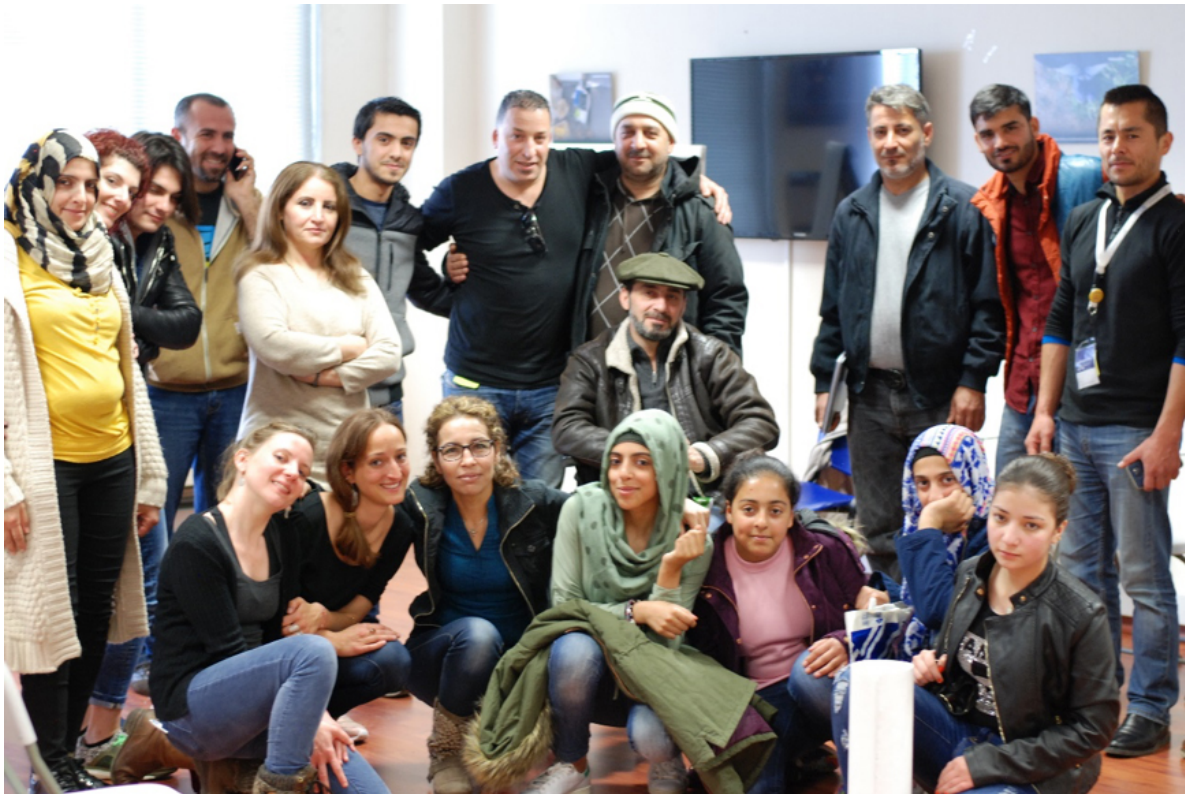
Les artistes et créateurs de l'exposition « Pain & Hope » et l'équipe de soutien psychosocial (MdM Suisse)

cette exposition a permis de valoriser les stratégies que les participants ont mis en place face à l'adversité, dans les situations de crises et les épreuves traversées. De plus, elle crée et renforce les liens entre les réfugiés et les communautés locales.