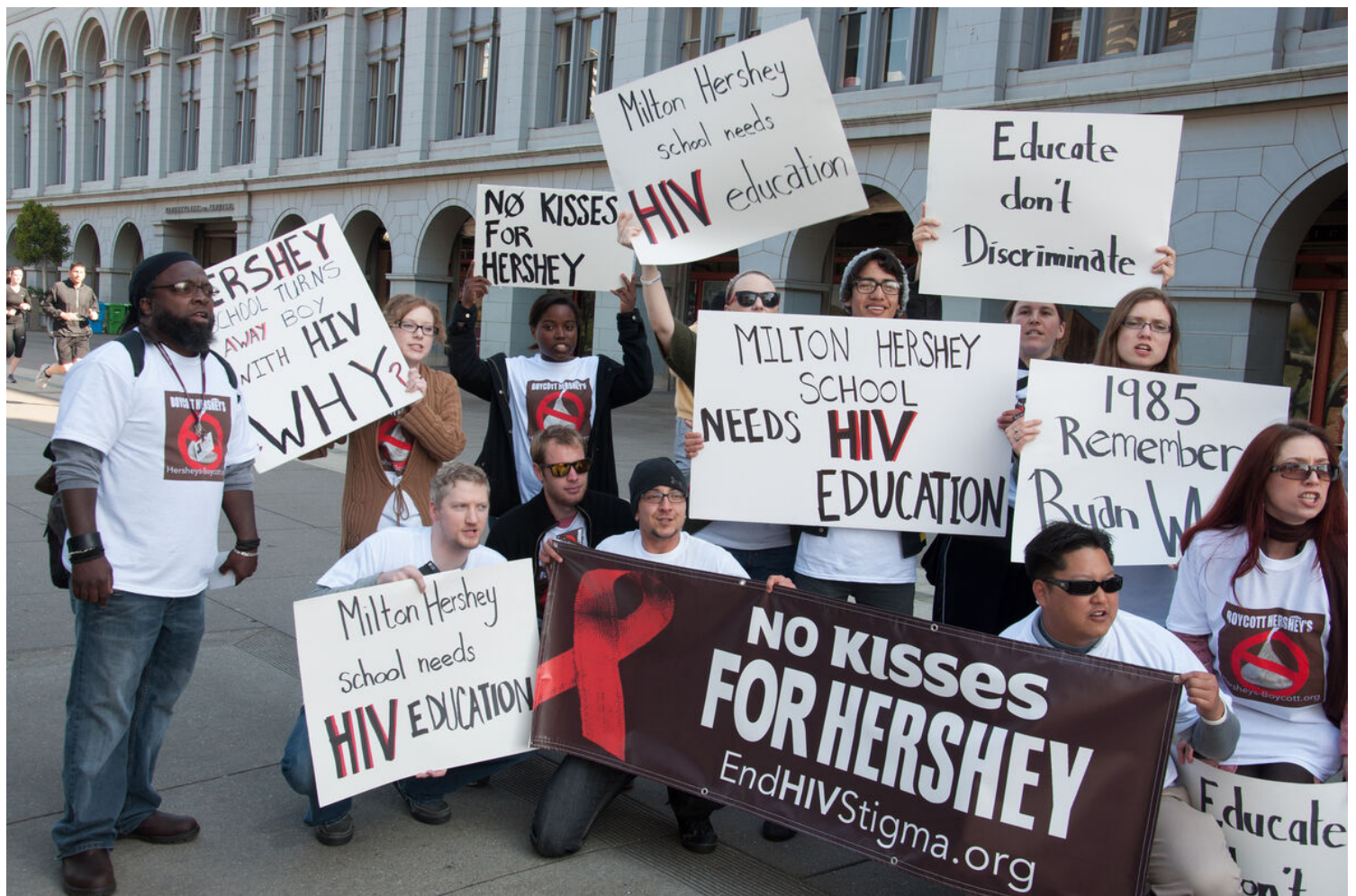
UNLV students on alternative spring break boycott Hershey Chocolate at San Francisco Ferry Building-0023