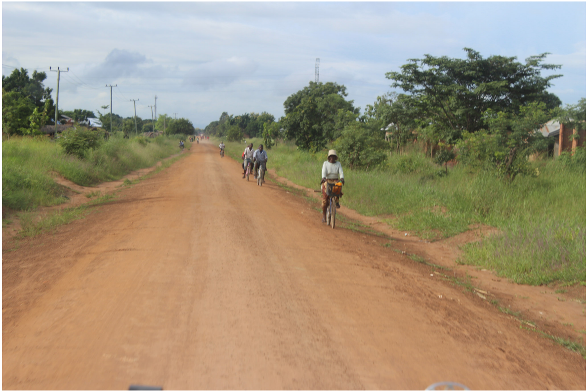
Tanzania 2015.

Statt sich in den Hauptstädten auf die Spitzenmedizin zu konzentrieren, sollte nun eine flächendeckende Betreuung angestrebt werden. Das Modell von der umgedrehten Pyramide (siehe Graphik) war der Ansatz für Fragen, welche das Konzept der Primary Health Care (PHC) aufwarf. Unter anderem die ethische Frage, ob man bei beschränkten Mitteln weiterhin 45% in die Behandlung von 1% der Bevölkerung einsetzen darf.