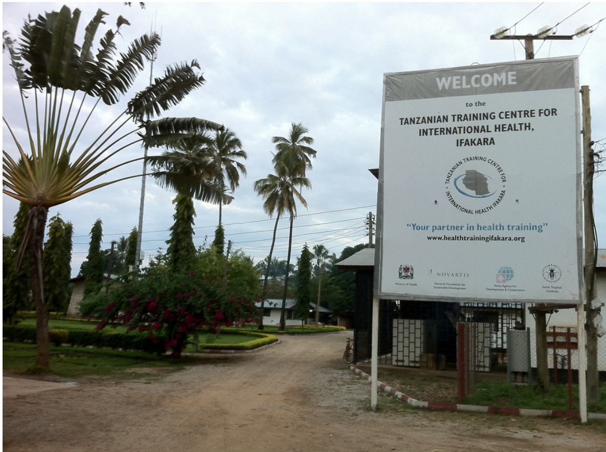
Tanzanian Training Centre for International Health, Ifakara. Photo: David Davies/flickr, CC BY-SA 2.0

Während dieser Zeit, Anfang der sechziger Jahre hatte ich in Tansania die Möglichkeit, als junger Schweizer Arzt einen Austausch zwischen Peripherie und Spital in die Wege zu leiten. Das im Südwesten des Landes gelegene Missionsspital von Ifakara war während meines Einsatzes Referenzzentrum für eine Reihe von medizinischen Aussenposten. Ich besuchte 1964 jede einzelne Gesundheitsstation, diskutierte mit den verantwortlichen Hilfspflegern (Rural Medical Aids) über ihre Bedürfnisse und Nöte und machte mir ein Bild über Einrichtungen, Medikamentenvorrat und diagnostische Möglichkeiten.