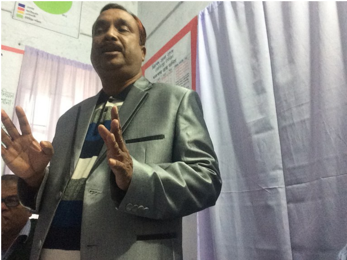
Gemeindevorsteher von Mominpur.

Das Interessante am Projekt des Lamb Hospitals ist, dass es auf eine Initiative der Gemeindemitglieder in Mominpur basiert. An jener durch den Imam eröffneten Sitzung waren die InitiantInnen versammelt. Zentrale Figur dabei ist der Gemeindevorsteher, der laut Pronoy Kumar-Ganguly die Bekämpfung der Kinderheiraten bereits in seinem Wahlmanifest zum Programm erklärt habe. Er sieht verschiedene Probleme für seine Gemeinde: Aufgrund der frühen Heiraten fallen die Mädchen aus dem Schulsystem. Sie sind dadurch sozial isoliert und auch der häuslichen Gewalt in ihren neuen Familien ausgesetzt. Sehr häufig müssen diese Heiraten auch schon recht früh wieder geschieden werden.