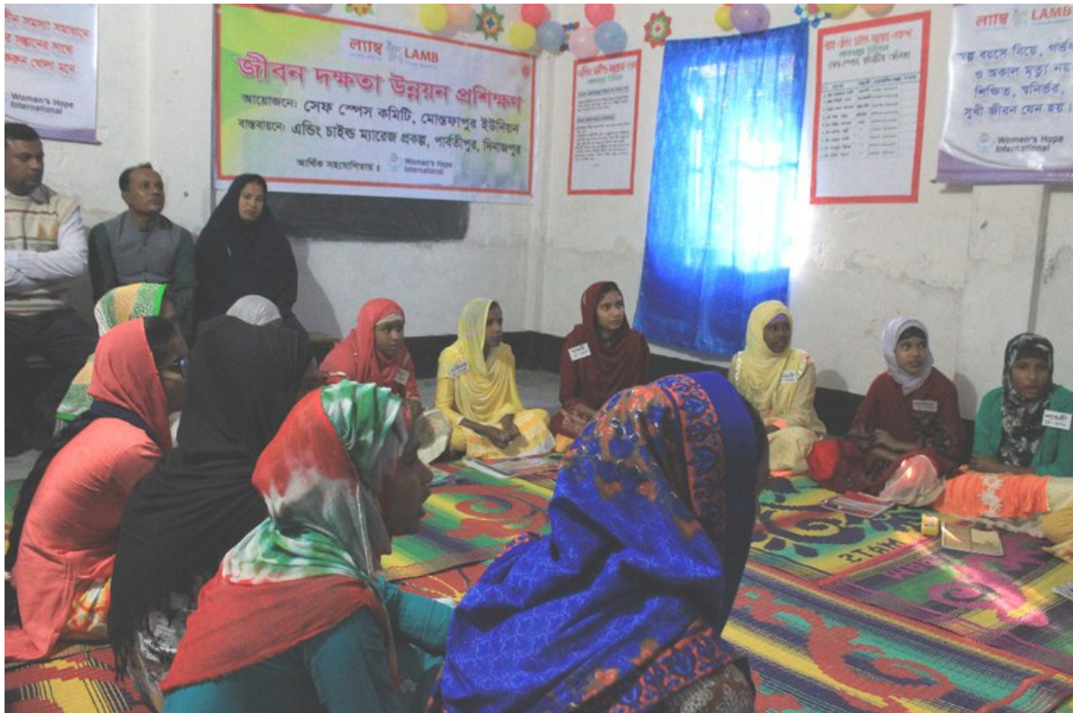
Schülerinnen der Mostofapur High School.

Schliesslich mangelt es an staatlicher Durchsetzungsmöglichkeiten der Gesetze: Vorgesehene Schutzmassnahmen der Behörden greifen kaum. Laut UNICEF verfügen in ländlichen Gebieten nur rund ein Drittel der Kinder über eine Geburtsurkunde.