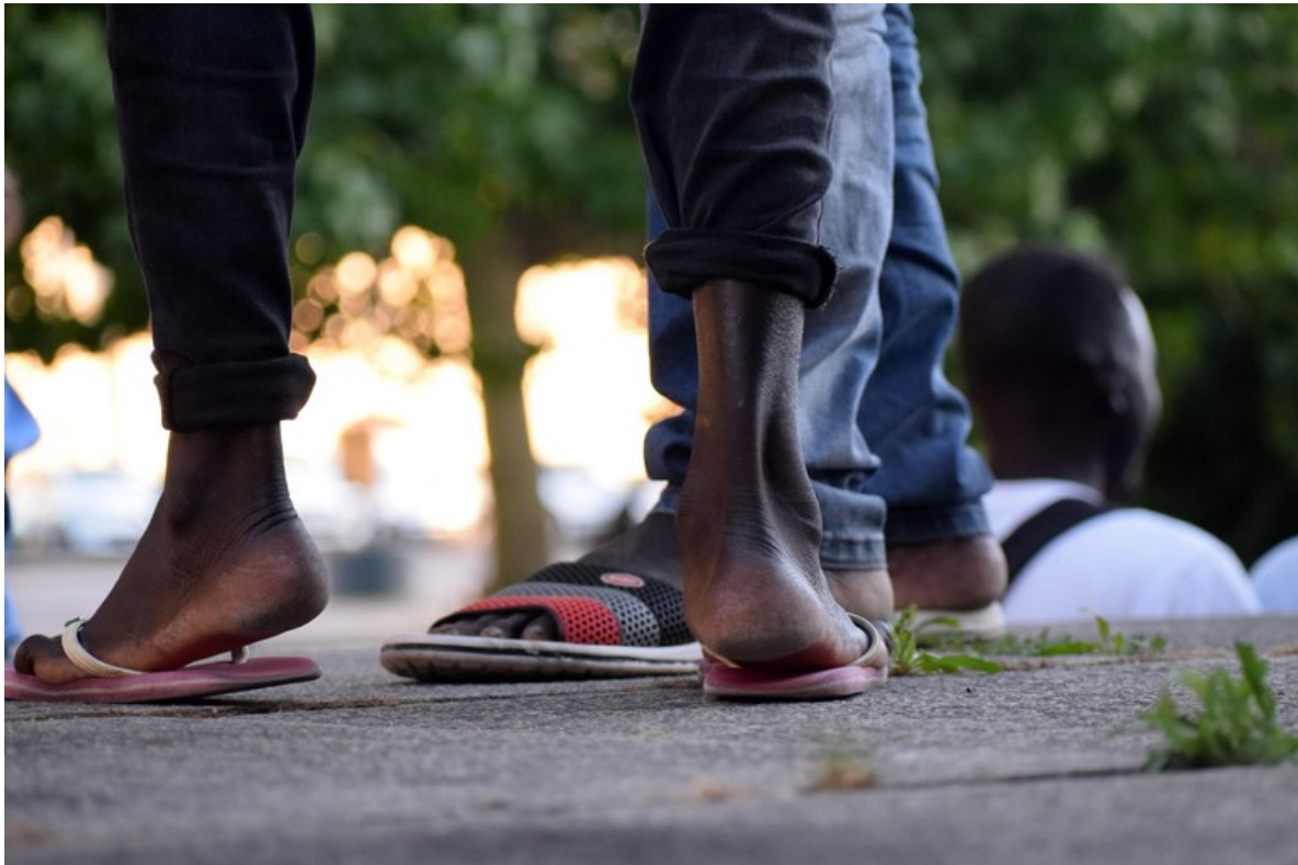
The Migrants.

Die Realität sieht allerdings aus verschiedenen Gründen anders aus. Eine Krankenversicherung abzuschliessen liegt oft weit ausserhalb der finanziellen Möglichkeiten der Betroffenen und ist meist mit allzu grossen administrativen Hürden verbunden. Wie Jossen (2018) beschreibt, gewährt nicht einmal der Abschluss und das Bezahlen einer Krankenversicherung einen unproblematischen Zugang zum Gesundheitssystem, insbesondere wenn eine Versicherung die Ausstellung einer Versicherungskarte verweigert. Dies kommt nicht selten vor, wenn Sans-Papiers noch keine AHV-Nummer haben und die Krankenversicherung ihrer Verpflichtung nicht nachkommt, eine solche zu beantragen. Deshalb suchen Sans-Papiers mit einem gesundheitlichen Problem sehr oft erst dann Hilfe, „wenn es nicht mehr anders geht“.