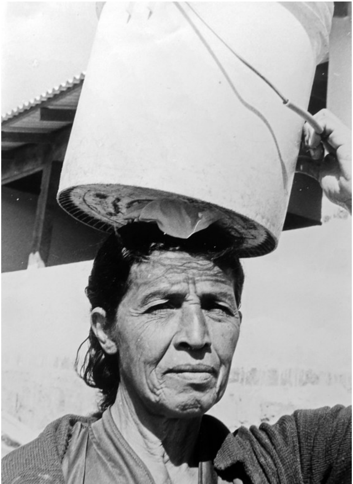
Armenviertel von Tegucigalpa.

Zu Hilfe kommen Christa Spycher Neugier und Wissensdurst. Fragend, immer im Austausch mit den Menschen vor Ort lernt sie die Alltagsmühen, insbesondere der von Armut betroffenen Frauen zu verstehen oder wird eine gute Kennerin lokaler Heilpflanzen und Gifftiere.