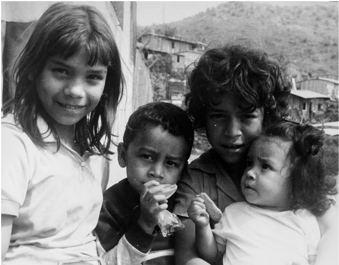
Menschen aus einem Armenviertel von Tegucigalpa.

Aus den ein, zwei Jahren werden schliesslich 16 Jahre in Lateinamerika, mit Stationen in Peru, Honduras und Nicaragua, unterbrochen von zwei Abschnitten in der Heimat.